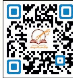
એપ્લિકેશન ડાઉનલોડ કરવા QR Code સ્કેન કરો

સૌ પ્રથમ Google Playstoreમાં જઈને સંસ્કૃતગૌરવપરીક્ષા એપ્લિકેશન ડાઉનલોડ કરી ઈ-મેઈલ આઈડીથી લોગઈન કરવું, ત્યારબાદ Register as institute પર ક્લિક કરવાથી સંસ્કૃતગૌરવપરીક્ષા સંબંધી માહિતી અને સુચનાઓ વાંચી સૌથી નીચે Continue બટન પર ક્લિક કરવાથી ફોર્મ ખુલશે. વિગતો અંગ્રેજીમાં સંપૂર્ણ ભરાઈ ગયા બાદ Register and pay Fee પર ક્લિક કરવાથી પેમેન્ટનું ઓપ્શન આવશે. તેમાં એટીએમ કાર્ડ, યુપીઆઈ, ગુગલ પે વગેરે દ્વારા પેમેન્ટ કરવાનું રહેશે. પેમેન્ટ થઈ ગયા બાદ આપને My Registrationમાં Waiting for confirmationનો સંદેશ બતાવશે. તેમાં સંસ્કૃતગૌરવપરીક્ષા કાર્યાલય દ્વારા ૨૪ કલાકની અંદર આપના રજિસ્ટ્રેશનની પુષ્ટી કરવામાં આવે ત્યાં સુધી વિદ્યાર્થીઓની યાદી માટેની એક્સેલ ફાઈલ ડાઉનલોડ કરી બધી વિગતો દેવનાગરી લીપિમાં ભરી તૈયાર રાખવી, ત્યારબાદ આપ પરીક્ષાર્થીઓના નામની યાદી (Excel File) અપલોડ કરી શકશો. તેમજ જુના પરીક્ષાર્થીઓની યાદી ડાઉનલોડ કરવી વગેરે પ્રક્રિયાઓ કરી શકશો.