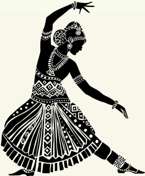
જિલ્લા શિક્ષણાધિકારી અમરેલી